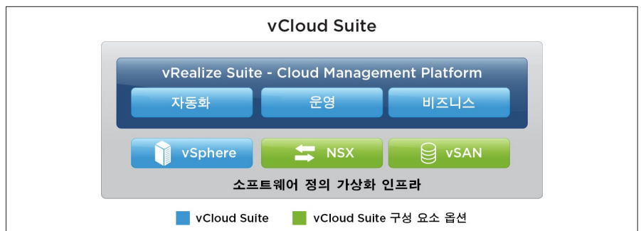
그림 1: vCloud Suite 통합 제품

VMware의 vRealize 클라우드 관리 제품은 또한 VMware SDDC를 구성하는 VMware vSphere, VMware NSX®, VMware vSAN™과도 기본 통합됩니다. 가상 라우터, 로드 밸런서 및 방화벽과 같은 NSX 구조를 vRealize Automation에서 생성한 서비스 템플릿(Blueprint)에 내장하여 비즈니스 요구 사항에 따라 실행 중인 애플리케이션의 상황에 맞게 온디맨드로 인스턴스화 및 변경할 수 있습니다.