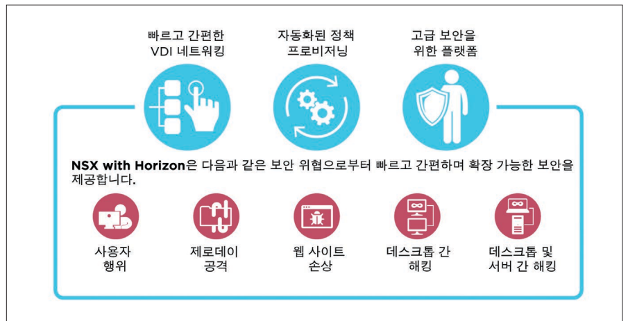
그림 5. VMware NSX with Horizon

VMware vSphere®에 대한 전문 지식을 활용하고 확장하여 데스크톱 및 애플리케이션 워크로드 제공을 간소화할 수 있습니다. 가상 컴퓨팅, 가상 스토리지, 가상 네트워킹 및 보안을 통해 가상화 성능을 더욱 높인 Horizon 7은 비용을 절감하고 사용자 환경을 개선하며 우수한 비즈니스 대응력을 보장합니다.