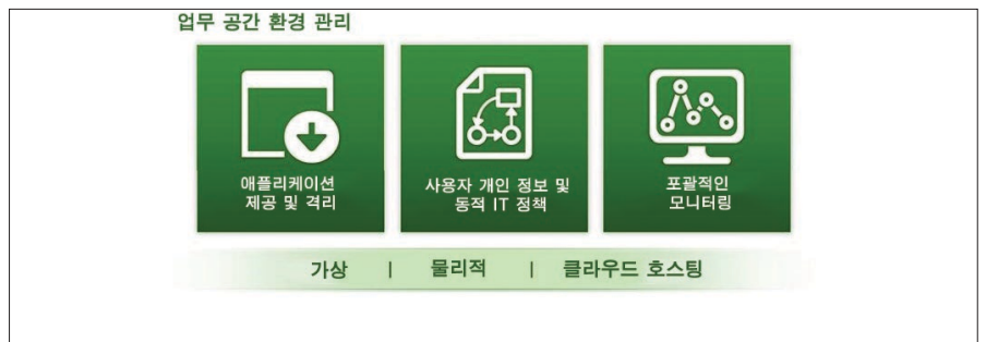
그림 3. 완벽한 업무 공간 환경 관리를 제공하는 Horizon 7

IT는 Horizon 7을 사용하여 긴밀하게 통합된 단일 플랫폼을 통해 제어를 통합하고 제공을 자동화하며 사용자 컴퓨팅 리소스를 보호할 수 있습니다.