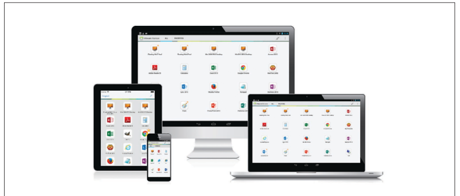
그림 1. 디지털 워크스페이스